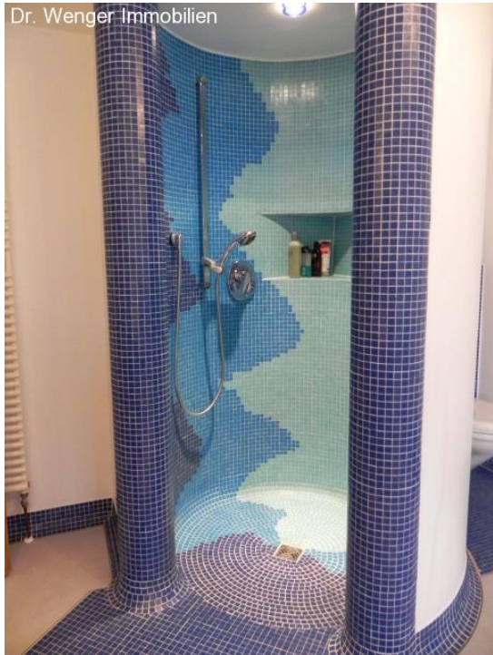
Bad Elternschlafzimmer: gemauerte Dusche.