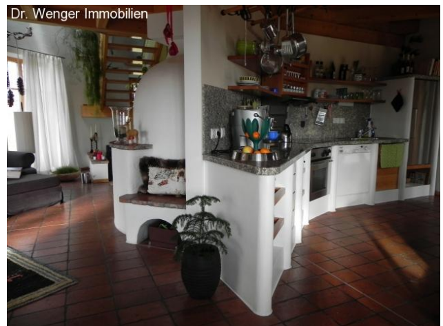
Links: Grundofen; rechts: Küche; Licht von allen Seiten!