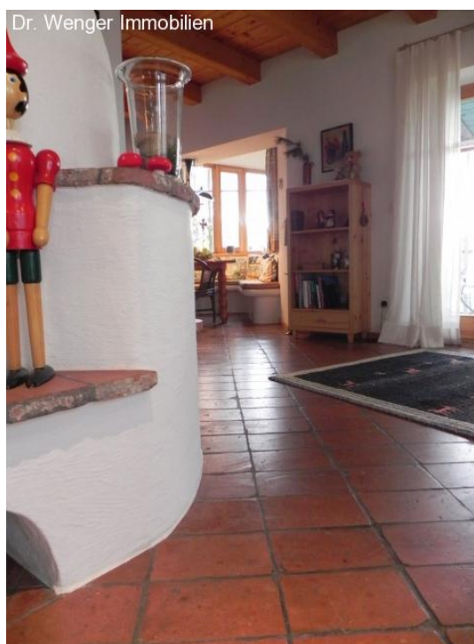
Der schön patinierte historische Ziegelboden.