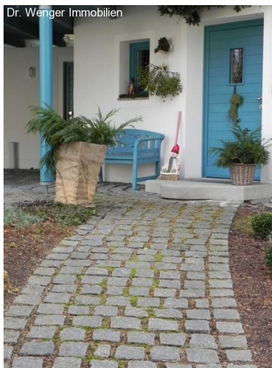
Freundliche Farben begrüßen den Besucher!

Das zweite Schlafzimmer (25 m 2 , aktuell Kinderzimmer, Erweiterungsbau aus 2001) erreicht man ebenfalls direkt vom