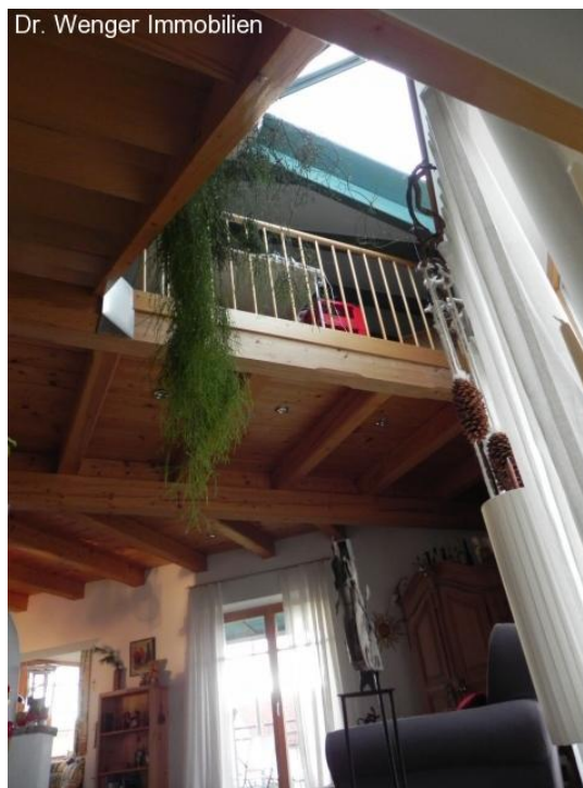
Impressionen: Obergeschoß mit Lichtgaube.

Das Haus steht in einer sehr guten und ruhigen Wohnlage in Ruhstorf an der Rott. Die Marktgemeinde Ruhstorf liegt im unteren Rottal am Rande des Niederbayerischen Bäderdreiecks. Ruhstorf gehört zum Landkreis Passau. Die Kreis-Stadt Passau (Universität, viele Kulturveranstaltungen von europäischem Rang) ist ca. 25 km entfernt. Alle Einrichtungen des täglichen Bedarfs sind in Ruhstorf vorhanden: Einkaufsmöglichkeiten, Ärzte, Apotheken, Kindergarten, Schulen und Banken. Sie finden hier auch eine