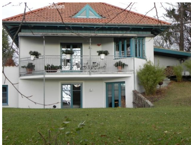
Das Hauptgebäude von Süden.

Vom Ofen nur durch eine Mauer abgetrennt, erreicht man die