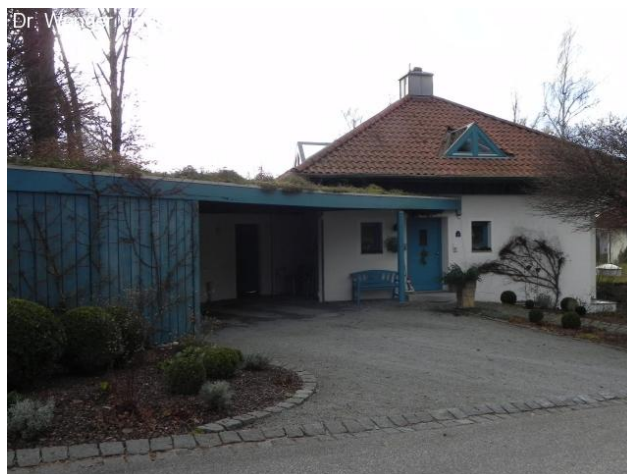
Begrünter Carport und Eingangsbereich.