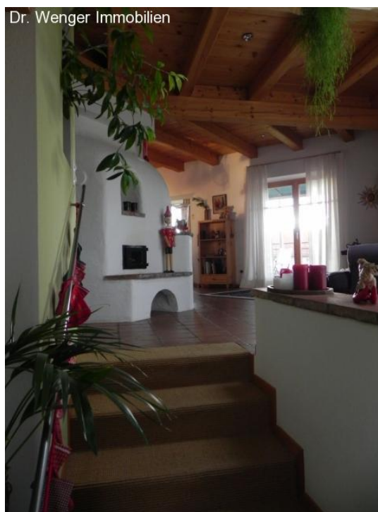
Aufgang vom Untergeschoß.