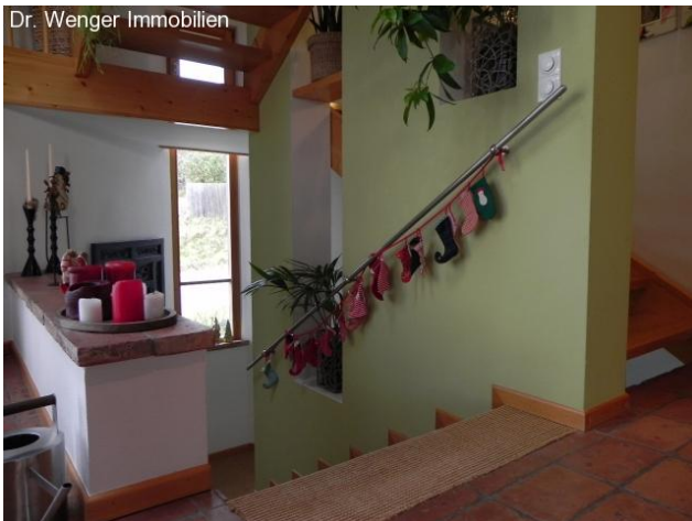
Zugang zu Unter- und Obergeschoß.