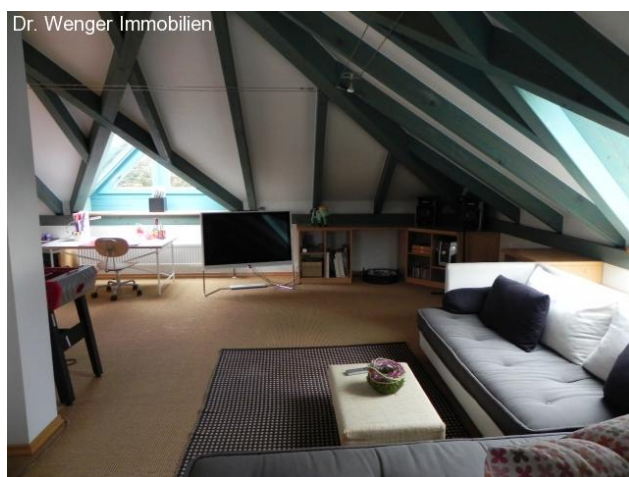
Lichtdurchfluteter Wohnbereich im Obergeschoß.