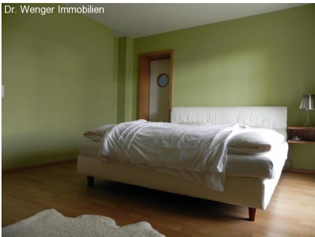
Elternschlafzimmer mit Zugang zum Bad.