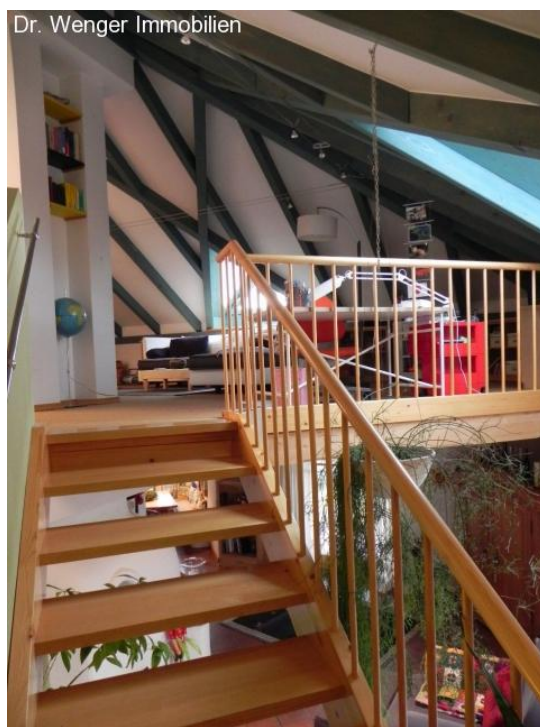
Obergeschoß mit Sichtdachstuhl.