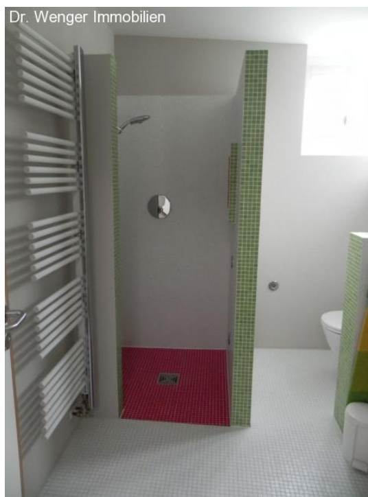
Bad Kinderzimmer: Gemauerte Dusche.