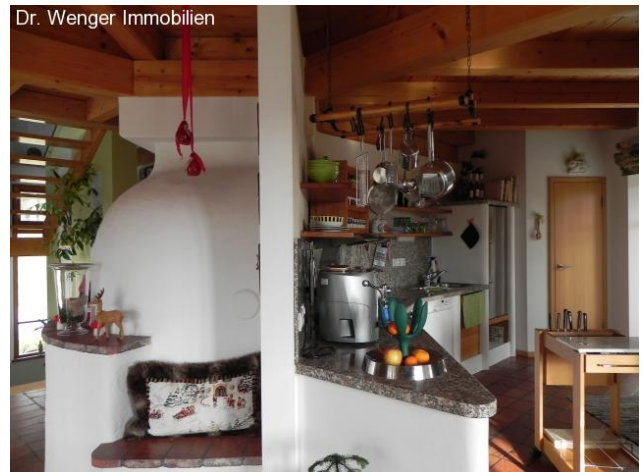
Links: Grundofen; rechts: Küche; Licht von allen Seiten!

Die von uns gemachten Informationen beruhen auf Angaben des Verkäufers bzw. der Verkäuferin. Für die Richtigkeit und Vollständigkeit der Angaben kann keine Gewähr bzw. Haftung übernommen werden. Ein Zwischenverkauf und Irrtümer sind vorbehalten.