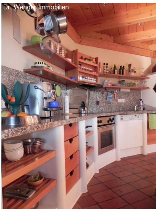
Die ergonomisch gestaltete Küche.

praktisch neuwertig Objekt-Nr.: 217 94099 Ruhstorf an der Rott Preis: 328.000 € Wohnfläche ca.: 190 m 2 Grundstück ca.: 1.030 m 2 Zimmeranzahl: 4