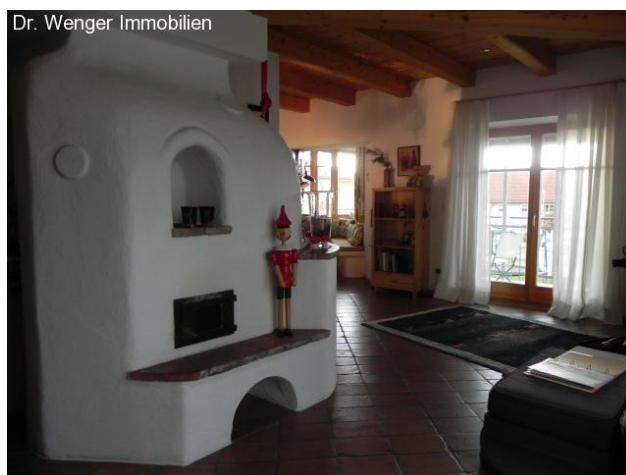
Grundofen; Zugang zum Balkon.

Bei der Begegnung mit diesem Objekt wird eines sehr schnell deutlich: ein Haus kann so viel mehr sein als nur umbauter Raum! In diesem Haus wird Raum geschaffen, gestaltet und zelebriert! Das gesamte Haus zeugt von Souveränität, Stil und Geschmack. Ein absolut perfekt gelungenes Architektenhaus!