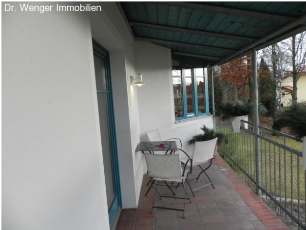
Süd-Balkon: überdacht und windgeschützt.